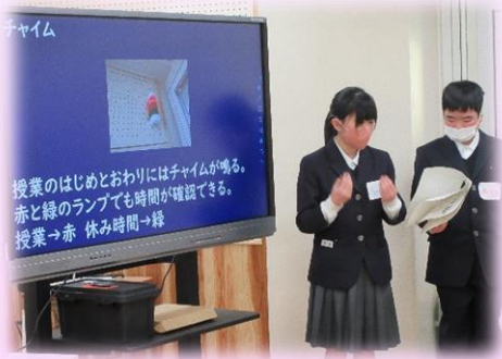
本校の紹介をしました。

事前に調べ学習をした上でこの日に臨みました。当日は講師の先生から直接お話を聞くことで、それぞれの国についてより深く知ることができました。