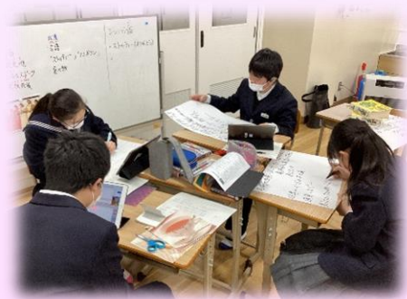
みんなで調べ学習をしている様子